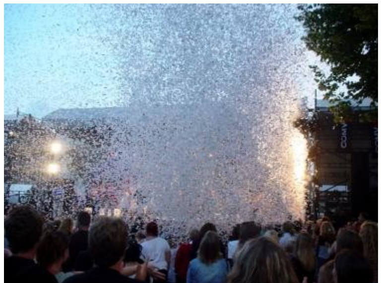
Konfettikanone im Einsatz 1

Wie viele Bögen benötigt man für 100 Tonnen Konfetti?